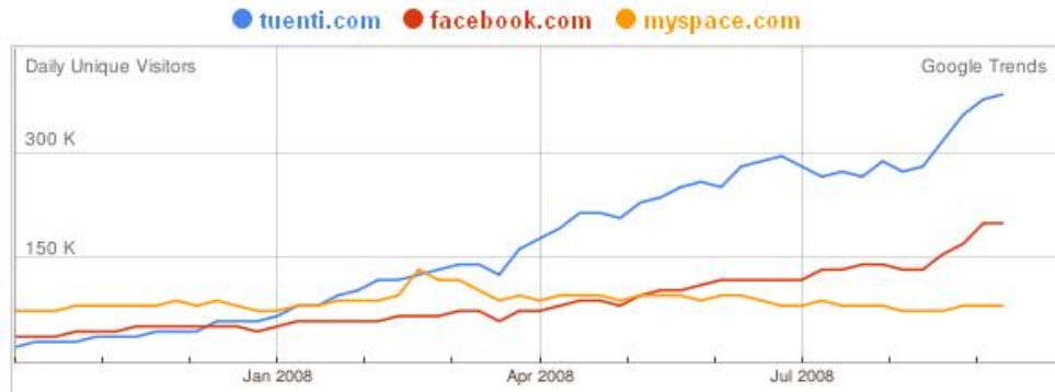
Gráfico 2: Número de visitantes únicos por red social en España (mayo - agosto 2008)